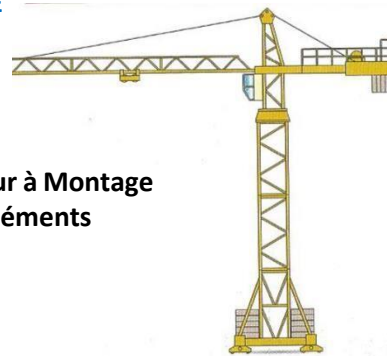
Grues à tour à Montage par Eléments